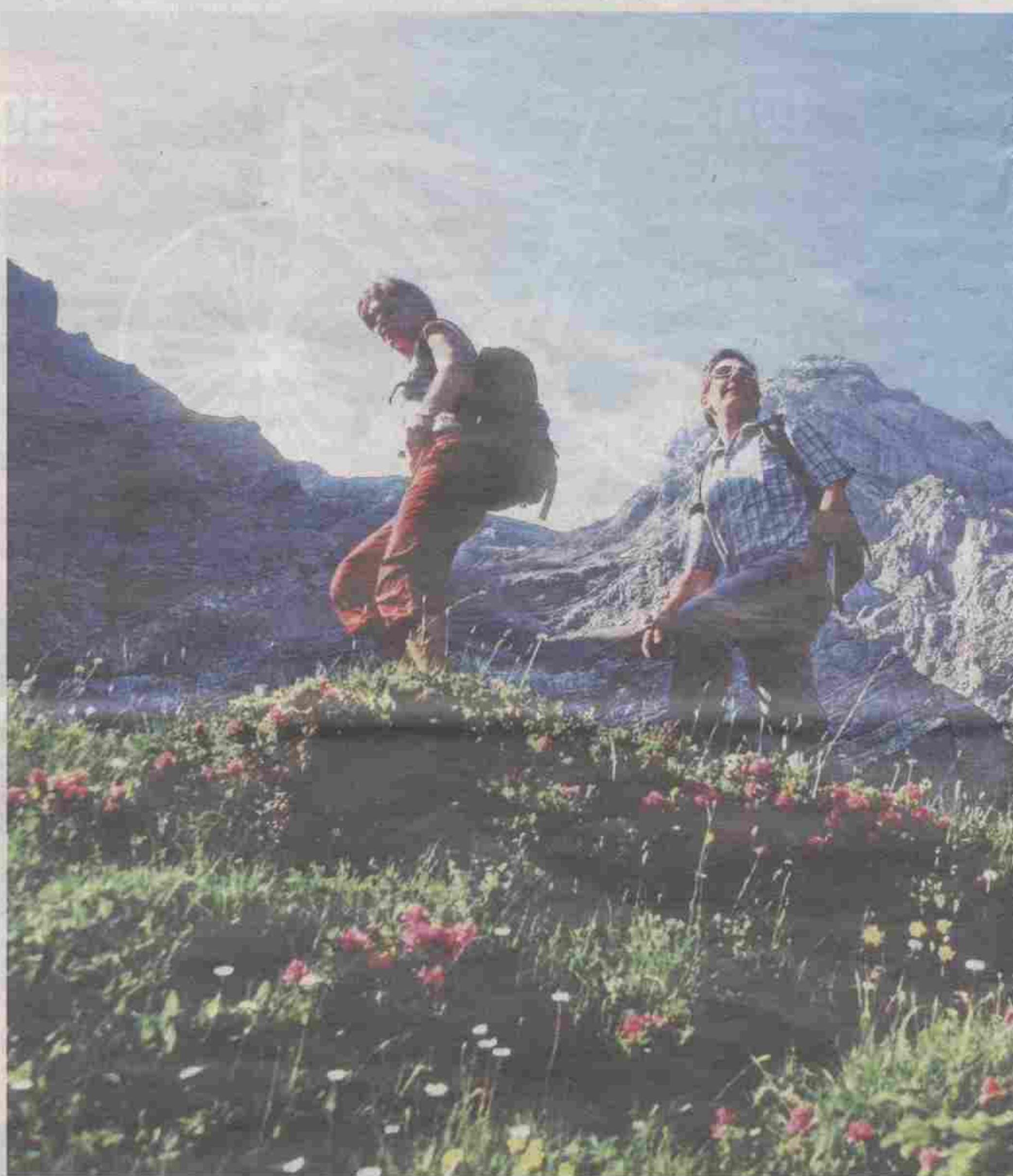
Pas besoin d'aller en haute montagne pour bénéficier d'un guide. La randonnée accompagnée dans les pâturages

Partir «juste avec le pique-nique dans le sac» ne suffirait-il donc plus à satisfaire le peuple de marcheurs que nous sommes? «De plus en plus de Suisses cherchent à redécouvrir la montagne autrement», souligne France Beslin, secrétaire de l'Association suisse des accompagnateurs en montagne (ASAM). En savoir plus sur la faune et la flore, trouver la balade originale et s'offrir le luxe du «on organise tout pour moi» dans un monde où l'on court toute la semaine, voilà autant de motivations qui alimenteraient une tendance à la hausse, selon les spécialistes. Et puis, il y a l'incontournable élément sécuritaire, même pour des randonnées qui ne réclament aucun matériel. «Autrefois, des enseignants organisaient parfaitement cer-